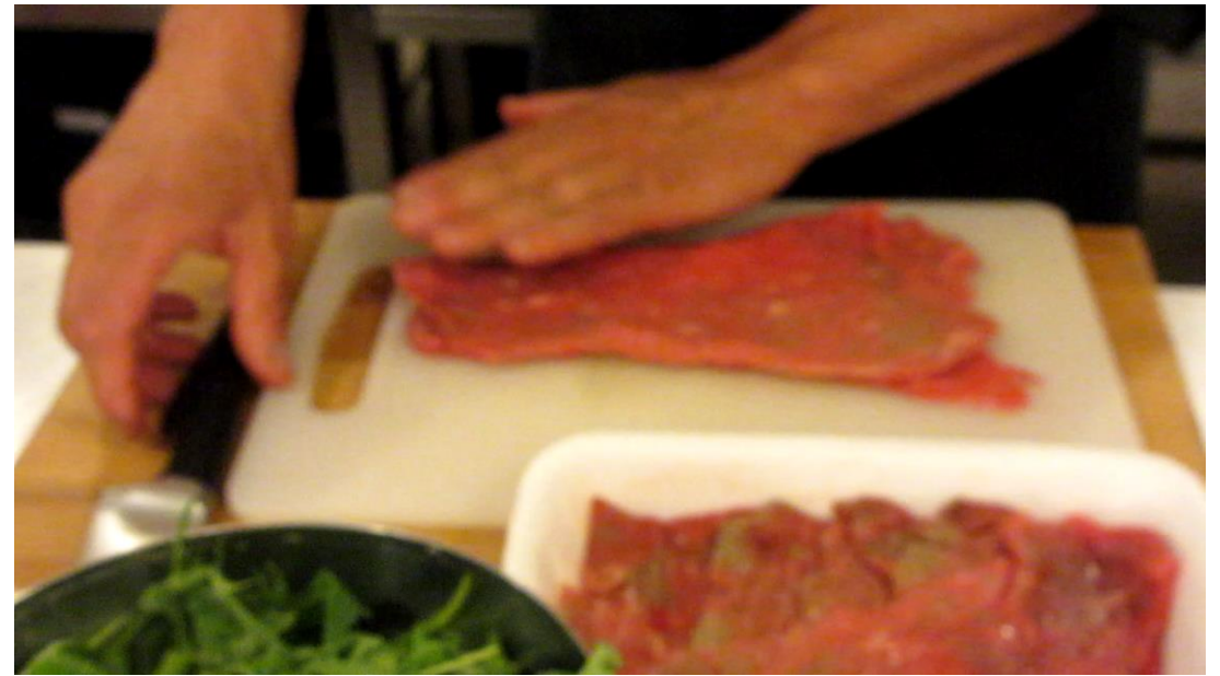
スカロッピーネ (薄切りにビーフ)