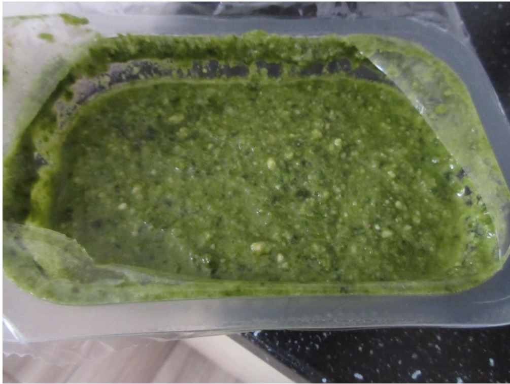
スーパーで買ったジェノベーゼソース