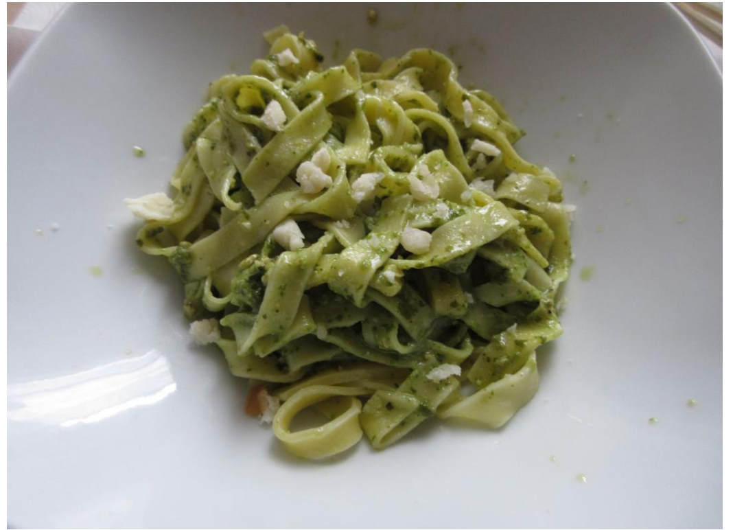
茹でたパスタにまぜて出来上がり